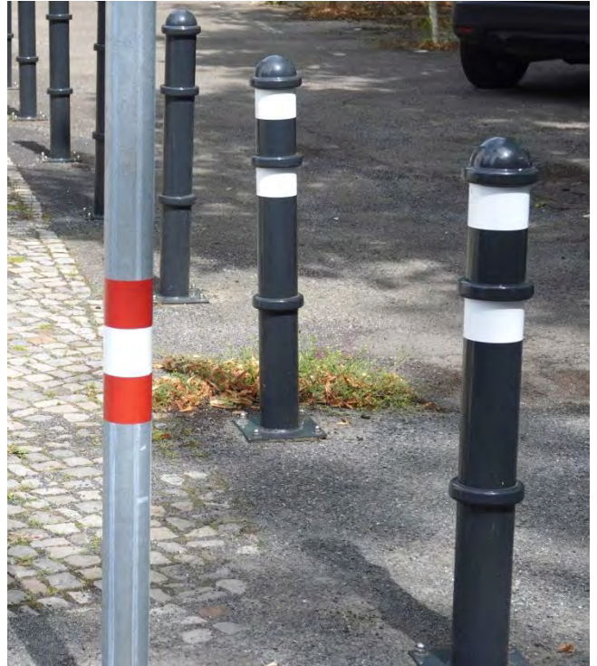
Bild: Die unterschiedliche Pollermarkierung bietet einen maximalen Kontrast.