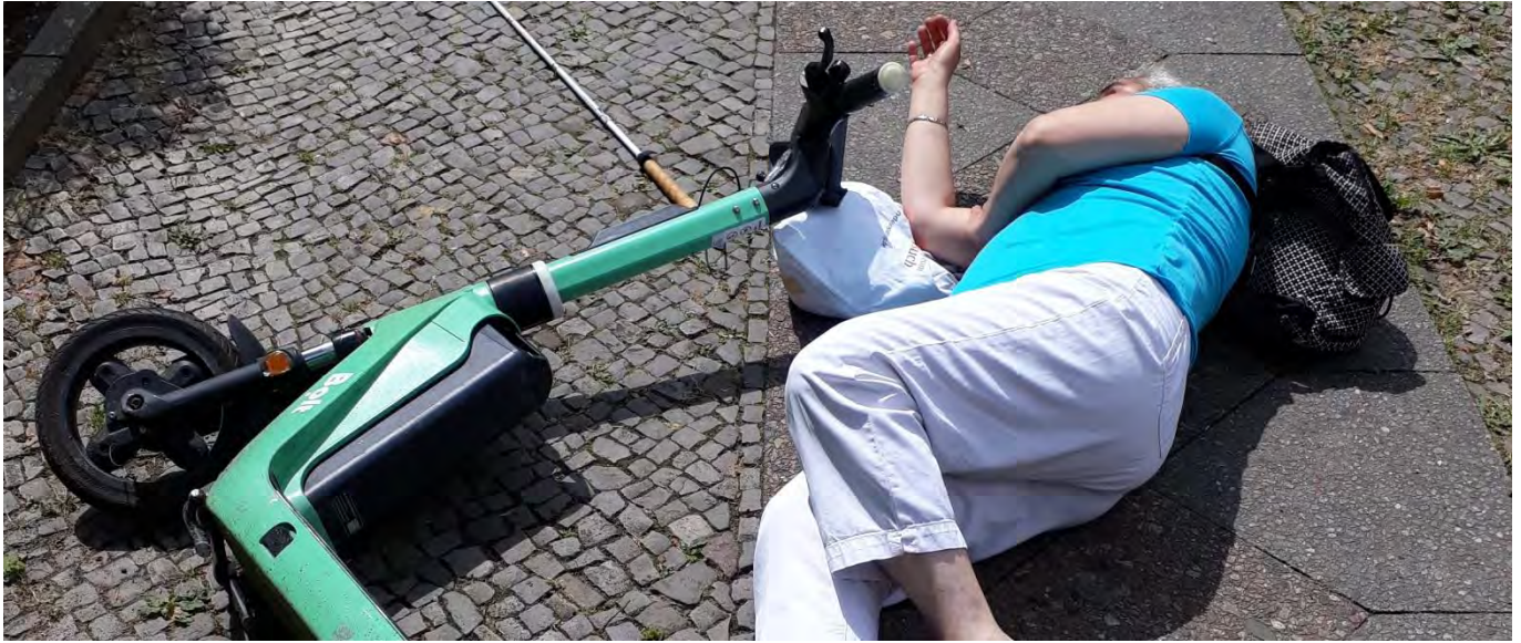
Bild: Sturzgefahr durch E-Roller auf Gehwegen.