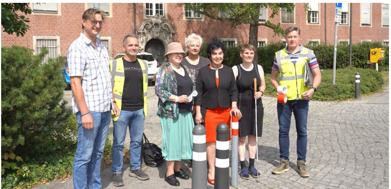
Bild: Premieren-Markierung von Pollern mit den Macherinnen und Machern aus Bezirksamt und ABSV.

Am 24. Juli 2023 traf sich das Projektteam mit der Bezirksbürgermeisterin Emine Demirbüken-Wegner zum Auftakt der Kennzeichnungs-Initiative am Parkplatz des Rathauses, wo bereits mit weißen Streifen gekennzeichnete Poller standen. Nun werden noch die zu kennzeichnenden Poller ermittelt, welche kontrastiert werden sollen, um das gefahrfreiere Laufen auf dem Gehweg zu erleichtern. Neu aufzustellende Poller werden hingegen ab sofort bereits ab Werk ►