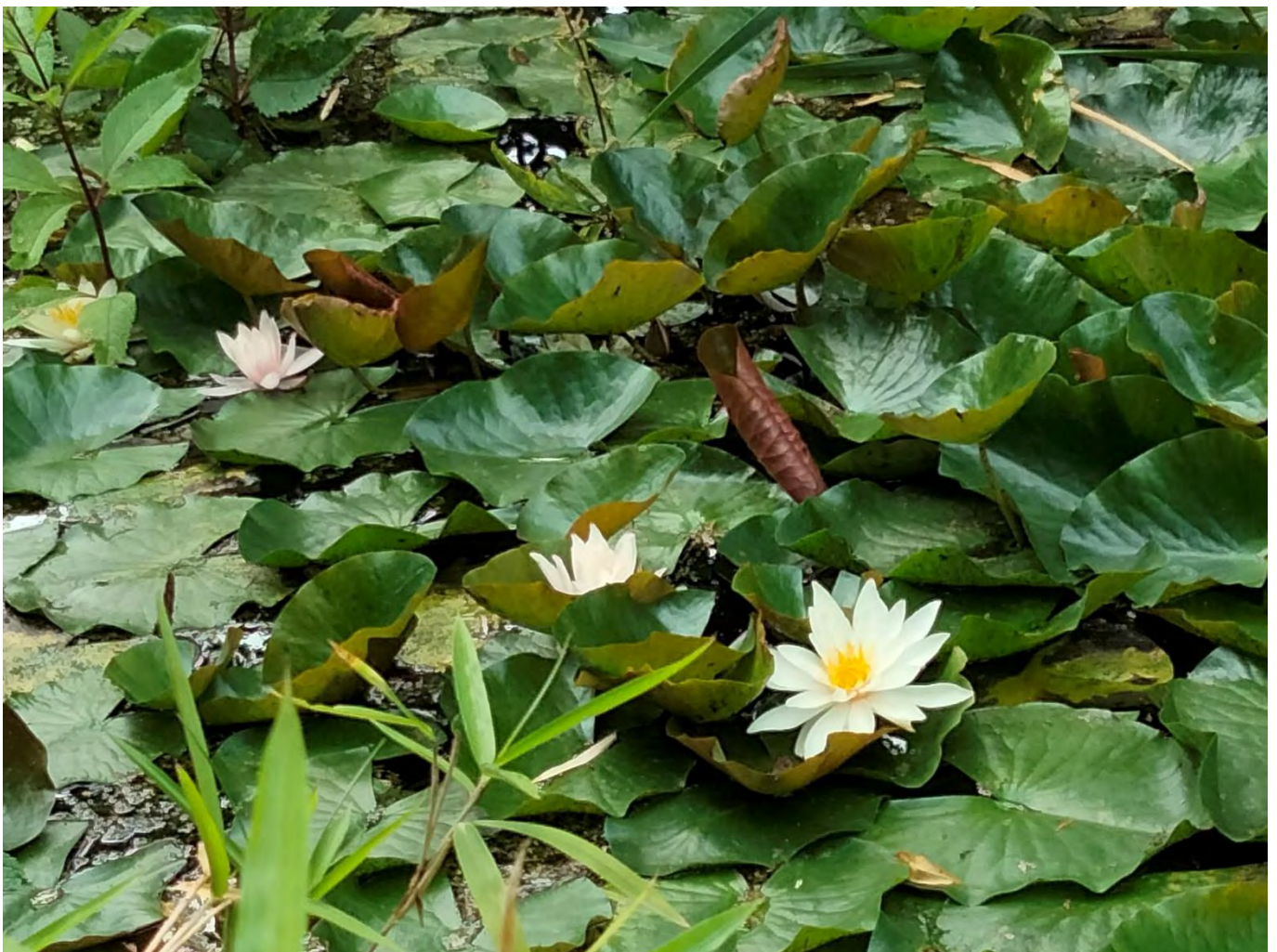
Bild: Isi hätte gern ein „Bassin zum Anfassen“: mit Pflanzen, an die man herantreten und die man fühlen kann.

Beim Gärtnern möchte Isi Mut machen: „Wir lernen ja durch Ausprobieren – einfach schauen, was geht, was geht nicht.“ ■